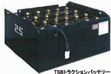
TSBトラクションバッテリー

JIS規格 D-5303-01「電気車用鉛蓄電池」の「試験方法」に基づく「寿命回数テスト」をTSB社が実施